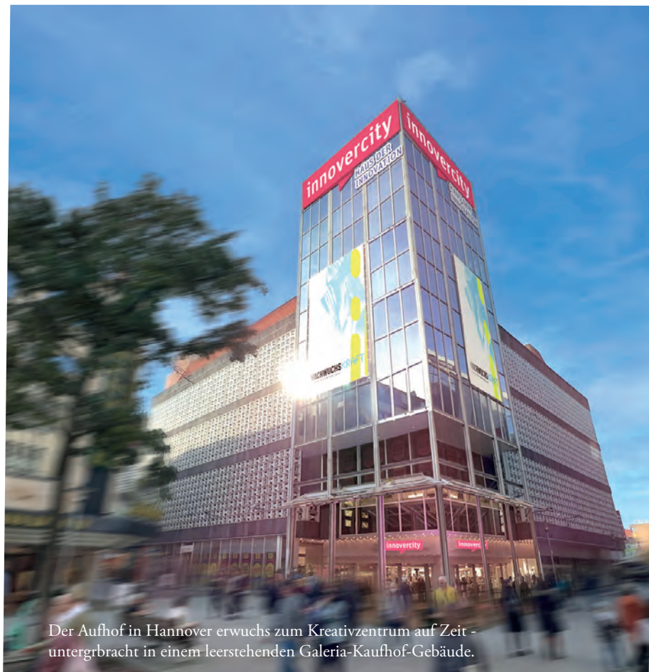
Der Aufhof in Hannover erwuchs zum Kreativzentrum auf Zeit - untergebracht in einem leerstehenden Galeria-Kaufhof-Gebäude.

Chillige Rückzugsrefugien, ein Schaukelkreis, ein „Baumhaus“ mit integrierten Arbeitsplätzen, zentraler IT-Support und vieles mehr sind im Brainhouse247 gesetzter Standard. Hier wird die Arbeitswelt von morgen völlig neu gedacht und ist räumliche Realität geworden. Ob Treppe, Stuhl, Hocker, Fensterbank oder offene Begegnungsräume – alles sind Arbeitsplätze. Und je nach Lust und